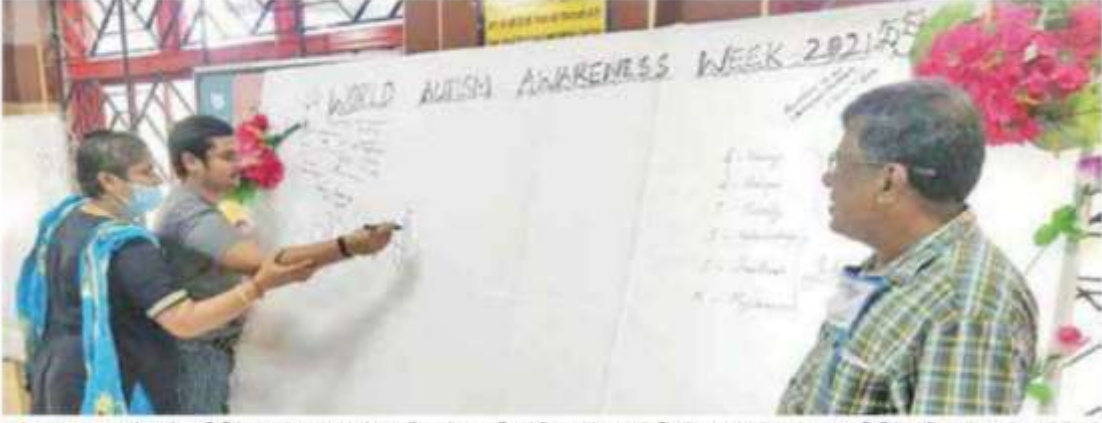
▲ உலக ஆட்டிசம் விழிப்புணர்வு வாரத்தையொட்டி, திருப்போரூர் ஒன்றியம் முட்டுக்காடு பகுதியில் செயல்படும் மாற்றுத் திறனாளிகளின் மேம்பாட்டுக்கான தேசிய நிறுவனத்தில் விழிப்புணர்வு கையெழுத்து இயக்கம் நேற்று நடைபெற்றது.